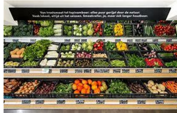
Groente en fruit