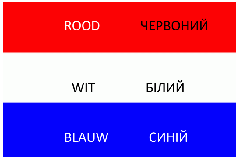
Nederlandse vlag - Голландський прапор