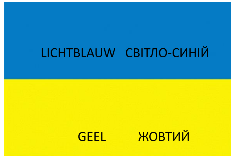
Oekraïense vlag - Прапор України